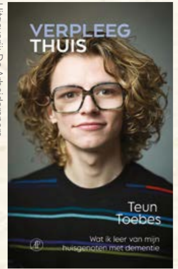
Uitgeverij: De Arbeiderspers